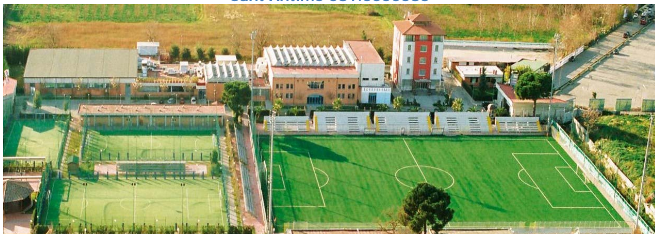
Nuoto – Basket – Palestra – Calcio- Albergo GRUPPO CESARO